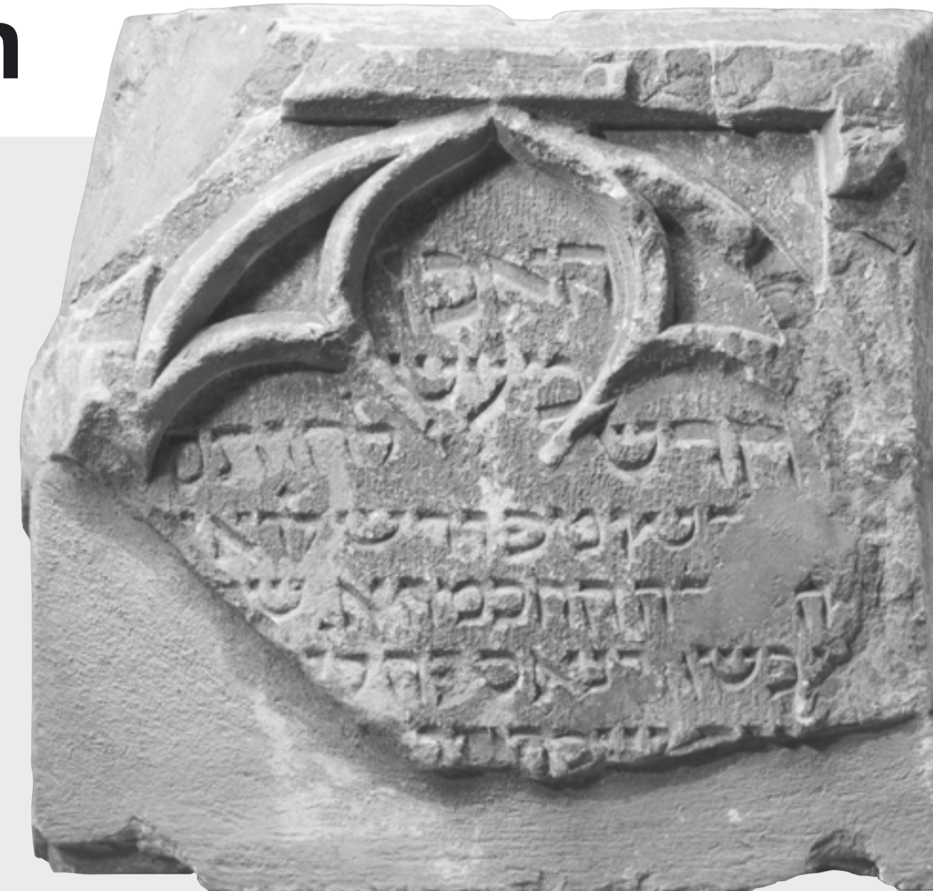
Sandsteinerner Grabstein mit hebräischer Inschrift, vor 1294(?), Bernisches Historisches Museum. Vermutlich war es der Grabstein einer Frau, die Inschrift ist aber stark fragmentiert, so dass weder Name noch eine Jahreszahl zu erschliessen ist.

Nichts ist übrig geblieben von der mittelalterlichen jüdischen Präsenz in Bern – ausser zwei Fragmenten von jüdischen Grabsteinen. Beide fanden sich in Wiederverwendung als Mauersteine in barocken Gebäudefundamenten. Der eine Stein kam 1888 im Vorfeld der Erbauung des Bundeshauses Ost im Mauerwerk des damals abgebrochenen Inselspital zum Vorschein. Dieses Spitalgebäude war 1718–1724 an der Stelle des mittelalterlichen Inselklosters errichtet worden. Der zweite Stein fand sich 1901 im Fundament eines der für die Erstellung des Bundesplatzes abgebrochenen Gebäude. Beide Steine sind heute im Bernischen Historischen Museum zu besichtigen.